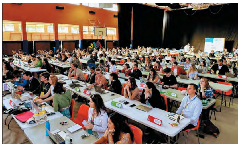
Az Európai Ifjúsági Fórum egy korábbi rendezvénye

A zsidó diákszövetség többször is magyarázatot kért a YFJ-től, ám több mint egy hónap elteltével sem kapott választ. Ezért nyilvánosan kénytelenek feltenni a kérdést, milyen lépéseket tervez az Európai Ifjúsági Fórum és annak szakértői csoportja az antiszemitizmus ellen.