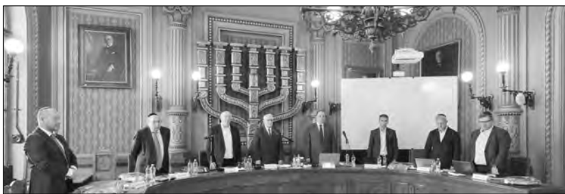
Egyperces néma felállás elhunyt hittestvéreink emlékére