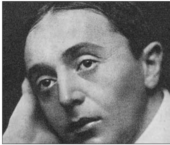
Szép Ernő portréja 1915-ből

A halk zavav, alacsony, szelíd, félnék fiatalember színdarabjai rendkívül népszerűnek számítottak a közönség körében, regényeinek megjelenése is mindig szenzációszámba ment. Verseket írt a kor híres színésznője, Medgyaszay Vilma számára, aki Szép Ernő kabaréjeleneteiben is szívesen játszott, az író pedig így emlékezett vissza rá: „A kedves emlékeztető Nagy Endre magyar kabaréjában pedig megjelenik a függöny előtt Medgyaszay Vilma, akit Miminek becézett az ország, aki elbűvölte-bájoalta művészeinket és közönségünket a Kárpátoktól az Adriáig. Az ő varázsára, az ő kedvéért írunk a chansonokat.”