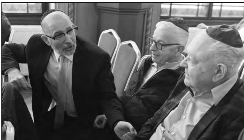
A nyitóimát a miskolci főrabbi mondta (balra)