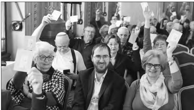
Binjomin rabbi a hölgykoszorúban