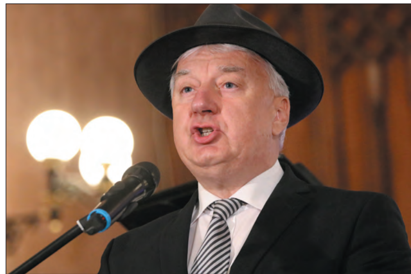
Semjén Zsolt: Zéró tolerancia az antiszemitizmussal szemben

tos eredménye ez, a magyar kormányzat következetes politikájának köszönhetően, mint ahogy az is, hogy nem engedi megtelepedni a fundamentalista, radikális iszlám híveit hazánkban.