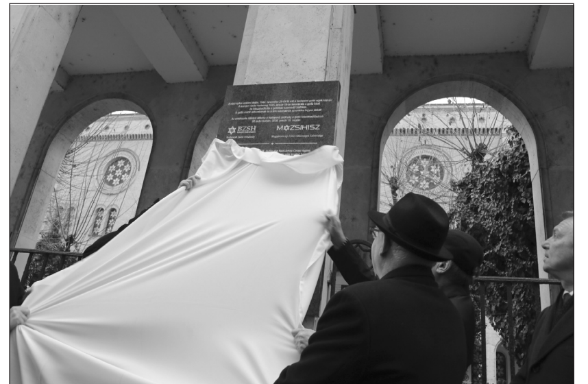
A magyar, angol, héber és orosz nyelvű emléktábla leleplezése

Majd jön egy másik tűz... milyen tűz ez? Más, mint a régi. Nem erdőn termett, a mélység dobta ki. Kiss József látnoki szavakkal fogalmazta meg azt a másik tüzet, amely szembe fordult a zsidóság lángjával. Az emberi ösztönök mélye, az aljasság,