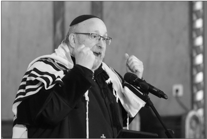
Frölich Róbert: Kétféle tűz van

A narrátor Avi Nir-Feldkleint, Izrael Állam Nagykövetségének megbízott misszióvezetőjét hívta a mikrofonhoz, aki beszélt országa megváltozott helyzetéről, a két órával ezelőtti sikeres tűzszünetről, a tűzok áradásának megkezdéséről. Szólt hazánk nyolc évtizeddel korábbi rettenetes történéseiről, megköszönve kormányunknak azt a bé-