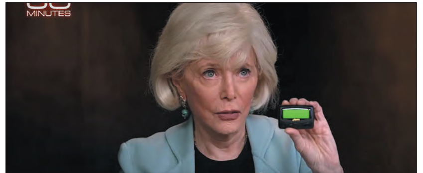
Lesley Stahl műsorvezető, kezében egy olyan személyhívóval, amelyet a Moszad adott el a Hezbollahnak

Tavaly szeptember 17-én a Moszad elindította a terrorrelhárítás történetének egyik legmerészebb és legkifinomultabb megátévesztését: egy személyhívókkal (csipogókkal) végrehajtott modern trójai faló hadműveletet. Az izraeli kémiszolgálat zsebben hordozható bombát kreált – és rávette a Hezbollah tag-