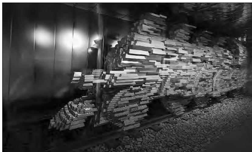
Az MNB aranyvonatának ábrázolása a Pénzmúzeumban

A szállítmány azonban 1945 májusában az amerikai hadsereg kezébe került. Az amerikaiak biztosították az értékeket, melyek jelentős részét – komolyabb egyeztetéseket követően – a háború után visszajuttatták Magyarországnak, ahol a há-