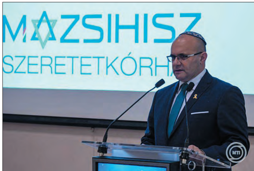
A kórház főigazgatója

körülmények között példamutatóan helytállnak, illetve azoknak is, akik adományok, támogatások útján segítik az intézmény működését.