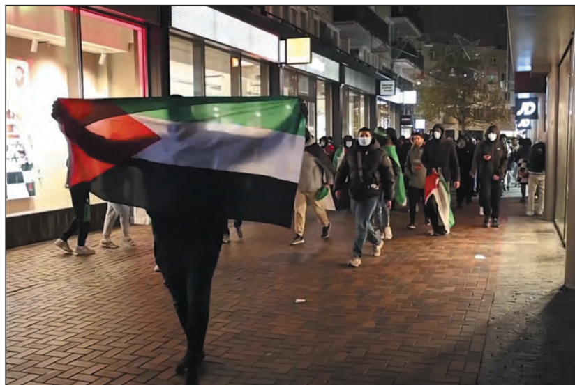
A második pogrom október 7. óta

Sokan pogromként jellemezték az élményt, amely felelevenítette a 2023. október 7-i támadások traumáját, különösen a hatóságok által nyújtott védelem hiányának fényében. (Times of Israel, Ynet)