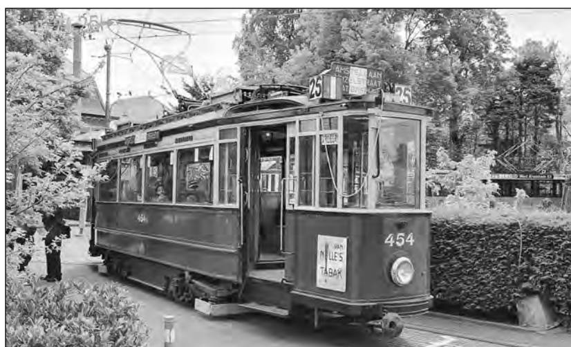
Régi amszterdami villamos

A rendező a hírportálnak azt nyilatkozta: a filmkészítés során rájöttek, hogy az amszterdami villamosvállalat szorosan együttműködött a náciikkal, akik járatokat is béreltek a cégtől a zsidók deportálásához. Kutatásuk új bizonyítékokat hozott napvilágra arról a villamosútról, amely Anne Frankot és családját 1944 augusztusában a weteringschansi