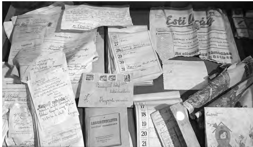
A falban talált iratok egy része