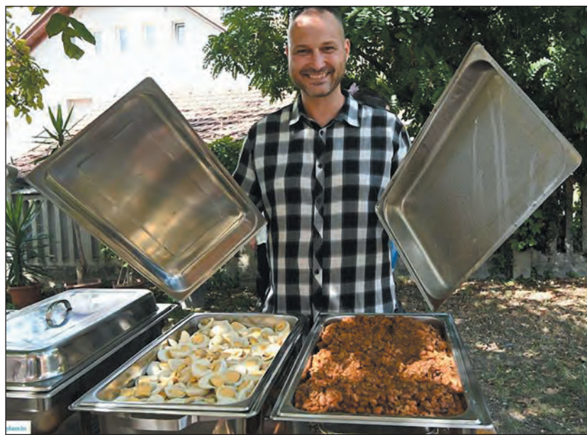
Mi szem-szájnak ingere