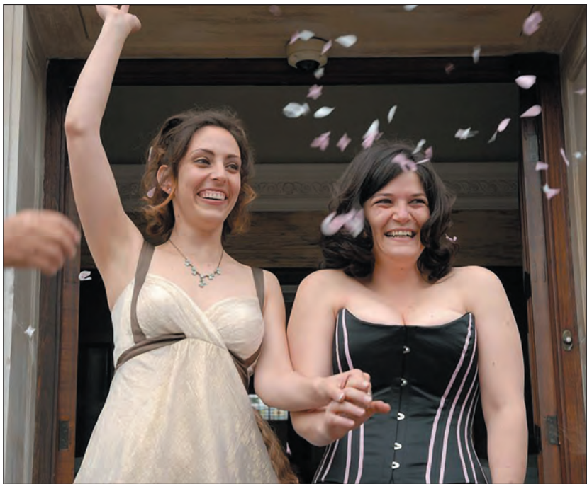
Izrael: anya és anya

A bírák nem értettek egyet a lakosság-nyilvántartó hatóság azon állításával,