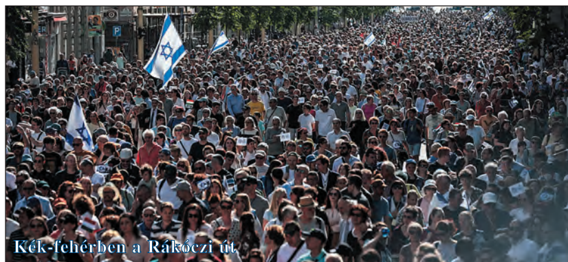
Kék-fehérben a Rákóczi úton