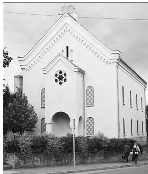
Az egykori tatai zsinagóga

De térjünk most át a történelem másik meghatározó paraméterére, az időre. Ugyanis a zsinagóga terének elpusztításához egyfelől szoros kronológiai rend vezetett, kezdve a 19. század nemzeti-liberális vívmányának, Eötvös József, Kossuth Lajos, Deák Ferenc, Jókai Mór, Andrássy Gyula és mások nagyszerű felismerésének, az emancipációnak a