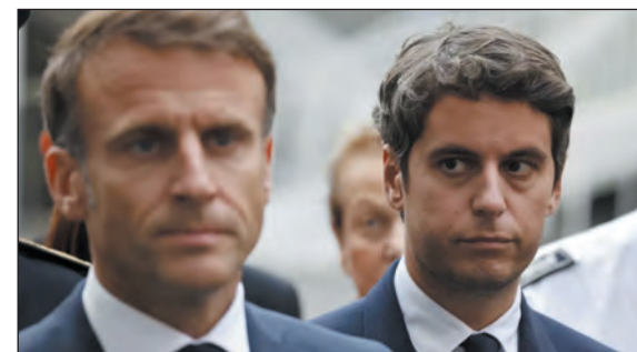
Franciaország. Macron kinevezte, Attal elfogadta

A szocialistáknál indult fiatal politikus 2016-ban csatlakozott a Macronhoz kötődő Újjászületés pártához. 2017-ben parlamenti képviselővé választották, 2020 és 2022 között kormánybiztos volt. Elődje, az apai ágon zsidó származású Elisabeth Borne kormányában az oktatási minisztériumot irányította.