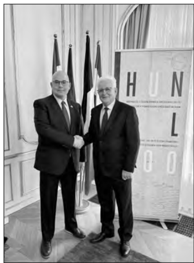
A Mazsihisz elnöke a nagykövettel

A másik téma a holokauszthoz kapcsolódó emlékhelyek megőrzésének fontossága volt a jövő generáció számára. A holokauszt még létező emlékhelyei 80 évesek vagy annál is régebbiek. Megőrzésük rendkívüli fon-