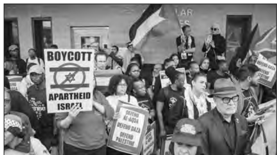
Gáza melletti tüntetés Johannesburgban

A johannesburgi Long Avenue-n egy kóser csemegebolt közvetlenül a kóser szupermarket mellett található, az utca túloldalán egy kóser burgerezőbe térhet be az erre sétáló. A