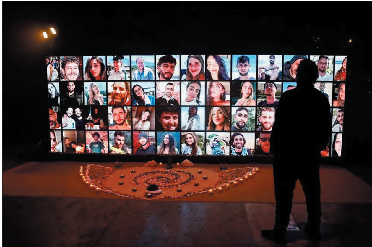
A Nova fesztivál elleni támadás néhány áldozatának arcképe a kiállításon

A látogatók belépnek a sötétben megvilágított fedett csarnokba, majd a „kemping területére” érkeznek, ahol sátrak és egyéb felszerelések hevernek a földön, mivel sokan elmenekültek a helyszínről anélkül, hogy idejük lett volna összeszedni a