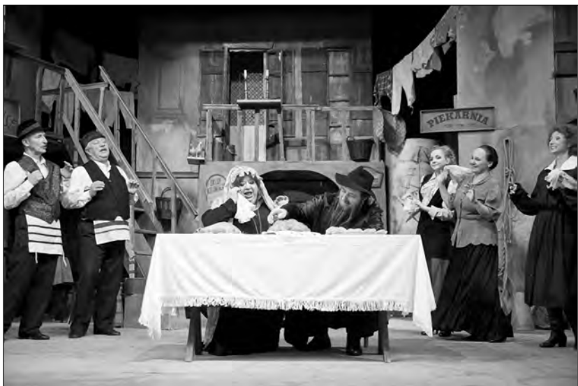
Jelenet a varsói jiddis színház egyik előadásából