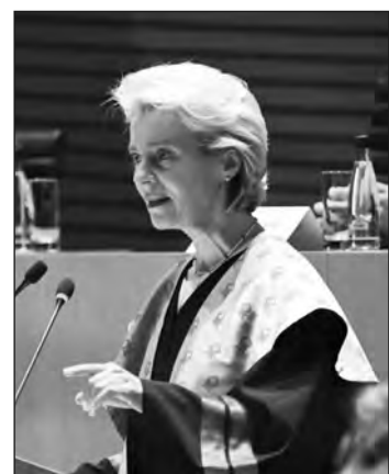
Ursula von der Leyen

„Kötelességünk, hogy olyan Európai Uniót alakítsunk ki, amely mentes az antiszemitizmustól, valamint a rasszizmus és a megkülönböztetés minden formájától. Ma ismét ki kell mondanunk: soha többé nem történhet meg” – tette hozzá közleményében az Európai Bizottság elnöke. (Gebauer Szabolcs/MTI)