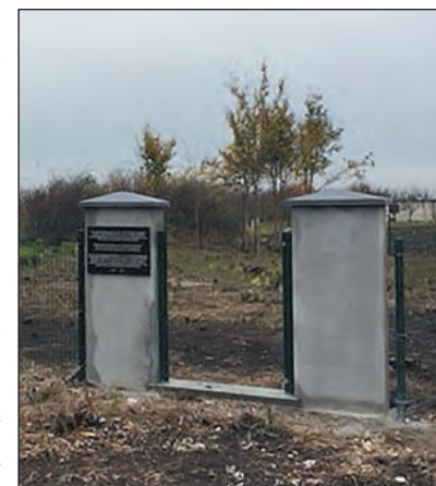
Szerbia. Az apatini temető a 19. századból

A második világháború előtt mintegy 60 zsidó élt az 1941 és 1944 között Magyarországhoz tartozó településen, akiknek a túlnyomó többsége a végső megoldás áldozata lett. Az ötvenes években a zsinagóga épületét baptista egyháznak adták el, jelenleg senki sem használja. Apatinban egy dróthálóval körülvett zsidó temető is található, amelyet a 19. század végén létesítettek.