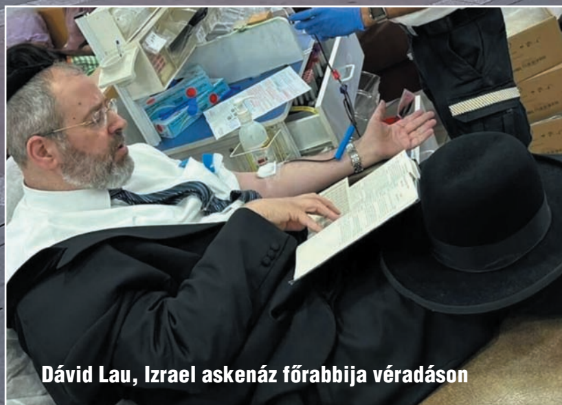
Dávid Lau, Izrael askenáz főrabbija véradáson