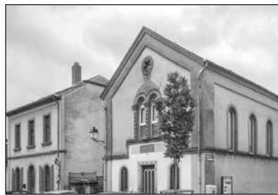
Luxemburg. Az ettelbrucki zsinagógát a nemzeti örökség részévé nyilvánították

tási rendezvényeknek, melyek segíthetnek, hogy toleranciában és kölcsönös tiszteletben éljünk.” „A felújított épületben a helyi zsidó közösség történetét is be kívánjuk mutatni.”