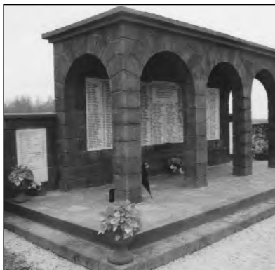
A devecseri mártíremlékű