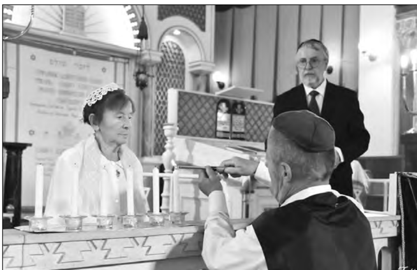
Újpest-Rákospalota. Az emlékezés gyertyáinak meggyújtása

poklot! ”. Pusztán szavakkal nem lehet kifejezni a megaláztatást és a csendet, amikor Auschwitzban a zsidók számára elfogyott a levegő, az idő és az élet.