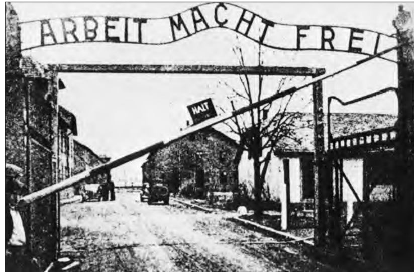
Egy ismert likudos aktivista vágýalma