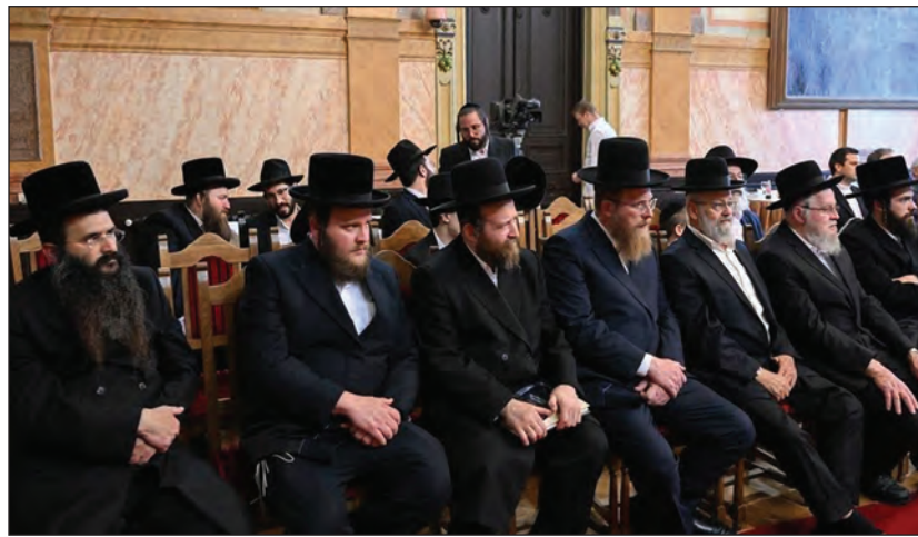
Ortodox delegáció látogatott a vármegyeszékhelyre

– Tegnap egri útjára elkísérte öt többek között az izraeli kormány Jeruzsálemért felelős minisztere, Meir Porus, Izrael Állam budapesti nagykövete, Jákov Hádász-Handelszman, valamint az egykori egri ortodox közösség számos tagja. Ők évtizedekkel ezelőtt Egerben éltek, de voltak olyanok is, akik Gyöngyösről vagy épp Verpelétről származnak. Történelmi tény, hogy ez a közösség jelentős mértékben formálta és alakította Eger városát építészeti, gazdasági és szel-