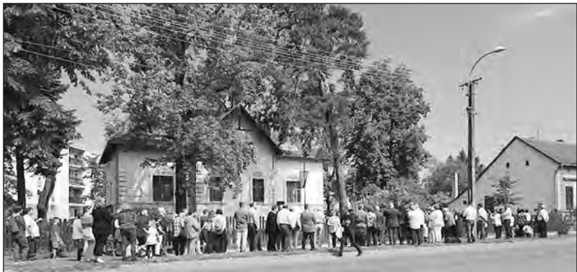
Sokan vettek részt a megemlékezésen