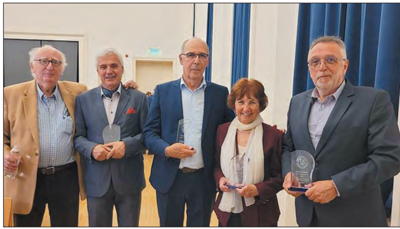
A friss Mensch-díjasok az alapítvány vezetőjével

A D-nap kapcsán Dénes Gábor filmrendező kiemelte: a szabadságot nem adják ingyen, a szabadságot harcolni kell, amit fontos megtanulnunk, hiszen D-nap mindig volt és mindig lesz, mert egy-egy helyzetben el fog következni a pillanat, amikor az emberek azt mondják: Elég volt! A normandiai partraszállásról Dénes Gábor azt mondta, az a nap volt a második világháború végének kezdete, s az a világraszóló összefogás arra hívja fel a figyelmet, hogy a félművelt, beképzelt diktátorok rit-