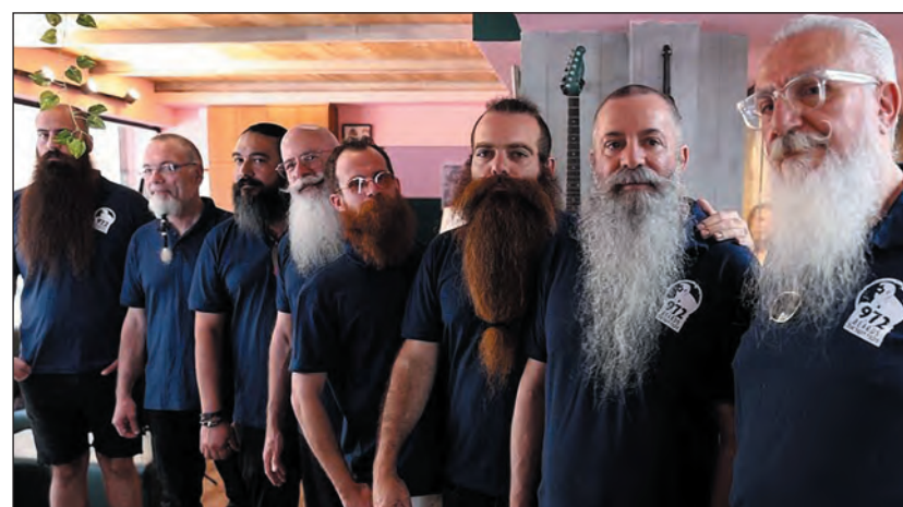
Az izraeli szakállválogatott