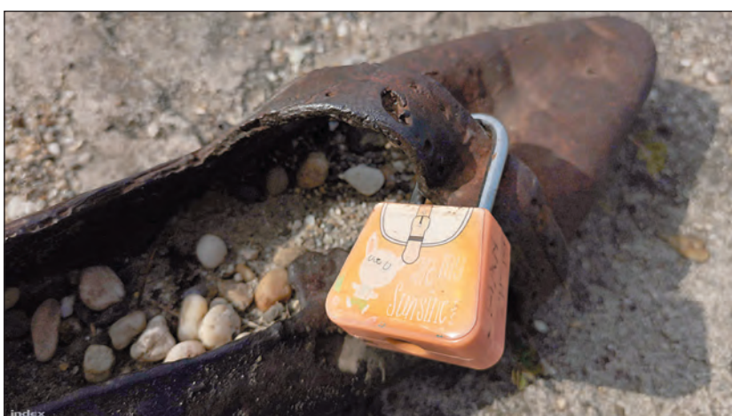
Szerelemlakat a Duna-parton