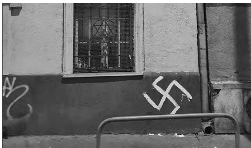
Ha megjelenik a falon a jel...

• Nyugat-Európában a kettős lojalitás toposza a legelterjedtebb antiszemita sztereotípiák, a lakosság széles rétegei hiszik, hogy a zsidók hűségesebbek Izraelhez, mint saját országukhoz. A spanyolok jóval több mint