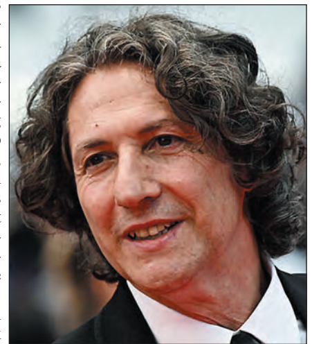
Jonathan Glazer, a díjnyertes film rendezője

„Szép házra és kertre, egészséges gyerekekre és friss levegőre vágytak. Az a borzalmas, hogy ezek az emberek nem szörnyetegek, hanem átlagos emberek. Hogyan lehetséges, hogy átlagos emberek ilyet tegyenek?” – mondta filmje alapkérdéséről a rendező.