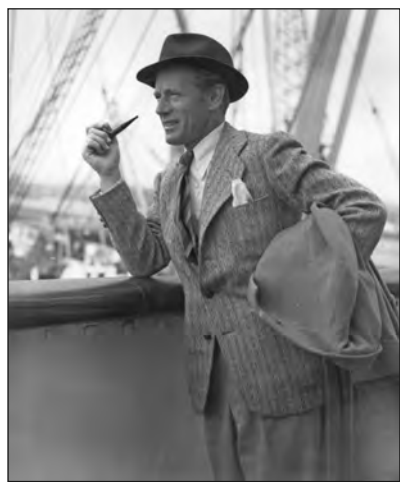
Úton hazafelé Angliába, 1939 végén

Az apai ágon magyar származású Leslie Howard az 1930-as évek legnagyobb angol férfiszíntáncosának számított, akiért bolondultak a nők, a második világháború idején pedig országa szolgálatába állva Nagy-Britannia hangja lett világszerte. Tragikusan korai halálát egy végzetes félreértés okozhatta.