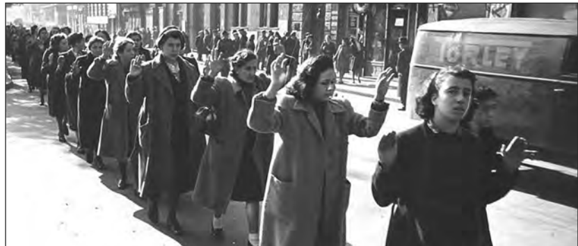
Zsidó nők 1944 októberében Budapesten

Lassan 80 éve annak, hogy a magyar zsidóságot a náci és magyar kollaboránsaik gettósították és deportálták, a holokauszttal kapcsolatban mégis számtalan téves elképzelés és előítéletektől vezérelt tévhit maradt fenn – olvasható a Telex.hu összeállításában, amely a felelősség elhárításából és elkenéséből származó, makacs tévképzetek közül szemezgetett.