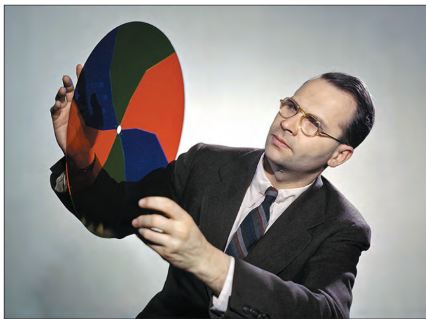
Goldmark és a színes adást lehetővé tevő forgótárcsa

Négy évvel később, 1940. augusztus 27-én a világon elsőként sikerült bemutatnia színes adást sugárzó televíziós berendezést: találmánya egy színszűrőként szolgáló forgótárcsa segítségével a három domináns színt (piros-zöld-kék) egymás után továbbította, másodperceként húsz képkocka sebességgel.