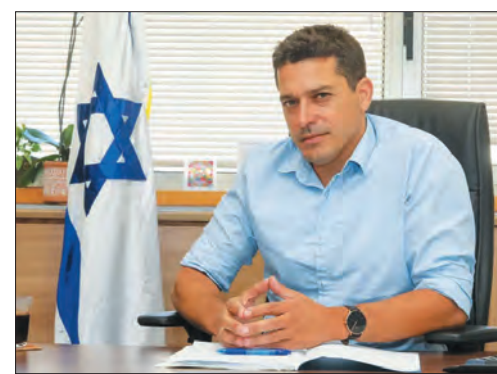
Amichai Chikli diaszpóraiügyi miniszter

Érdekes, hogy az izraeliek közül az ultraortodoxok támogatják a legjobban (43%) azt, hogy az izraeli kormány több mint félmilliárd dolláros költségvetést különítsen el a diaszpórában élő zsidó élet támogatására. Őket követi az ún. vallási közösség 41%-kal, míg a hagyományos izraeliek (30%) és a szekuláris izraeliek mindössze 23%-a ért egyet az ilyen típusú költségvetéssel. Ez összesen 30%-os izraeli támogatottságot jelent.