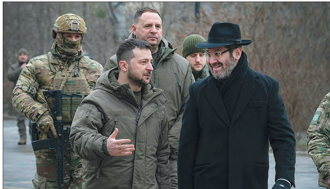
Raphael Rutman rabbi Volodimir Zelenszkij ukrán elnökkel beszélget

Az uniós biztos kiemelte, hogy a szövetség tevékenysége Ukrajna valamennyi régiójára kiterjed, de főleg a háború által leginkább sújtott és a legnehezebben megközelíthető területeken nyújt támogatást a rászorulóknak, zsidó és nem zsidó közösségek tagjainak egyaránt. Emberek életét védelmezi, élelmet, szállást, higiéniai ellátást és gyógyszereket biztosít, vagy az evakuálásban segít, annak ellenére, hogy munkatársainak testi épsége veszélyben van. (MTI)