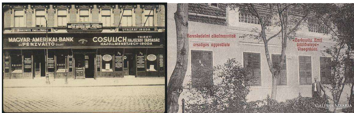
Zerkovitz Emil cége és visegrádi üdülőtelepe

Családja hazahozatta. Síremléke a Kozma utca sírkertben látogatható. (5/B-11-1)