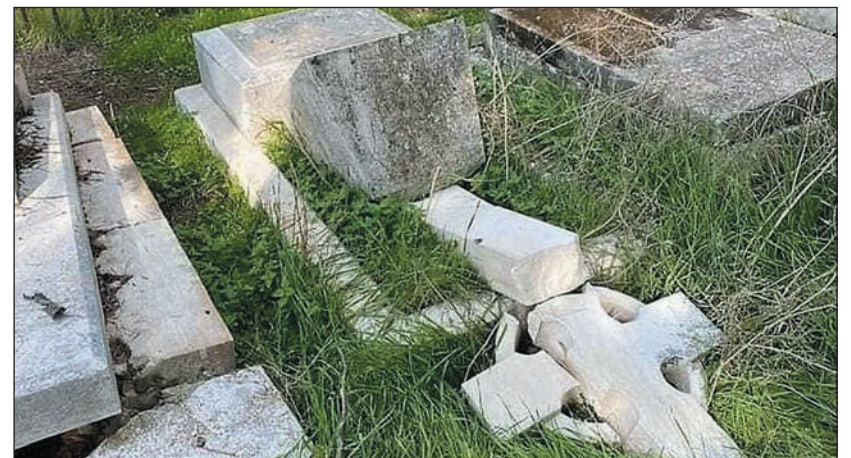
A ledöntött sírkövek a jeruzsálemi Cion hegyi protestáns temetőben

A kárt 100 ezer dollárra becsülik. Hasonló bűncselekményt követtek el 2013-ban is, amely miatt négy zsidó gyanúsítottat tartóztattak le. (Shiri Zsuzsa, MTI)