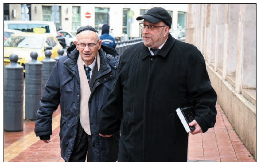
Jád bejád, kéz a kézben. Az országos főrabbi Lebovits Imre túlélőt kíséri az emléktáblához

Egy olyan tömegszálláson voltunk az Akácfa utcában, ahol egy földszinti szobában több mint 20-an zsú-