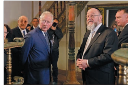
III. Károly még hercegeként és Ephraim Mirvis főrabbi a jeruzsálemi Izrael Múzeumban 2020 januárjában

„Az ortodox zsidó élet nagyobb befogadásának szószólója, kinevezte Nagy-Britannia első női halachikus tanácsadóját, és nagyobb lehetőségeket teremtett a női vezetés és a női ösztöndíjak számára” – olvasható az indoklásban.