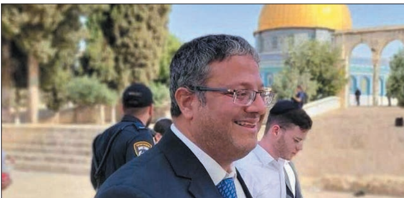
Ben-Gvir a Templom-hegyen

szempontból nagyon kényes helynek számító jeruzsálemi Templom-hegyre. Izraeli miniszter évek óta nem járt ott – jelentette a Ynet, a Jediót Ahronót című újság hírportálja.