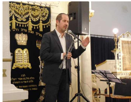
Összeállította: Dr. Goldberger Tamás