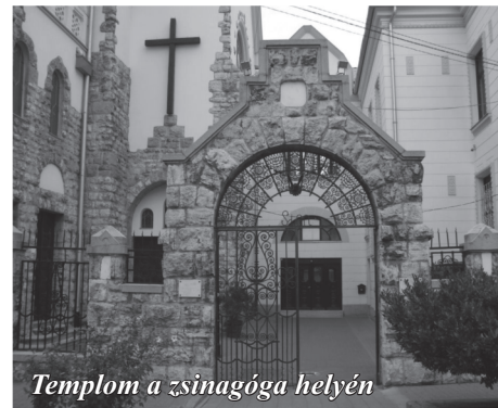
Templom a zsinagóga helyén

ban rendezett, holokausztra emlékező kiállításon láttuk meg nagypapám (fényképész volt) különböző zsidó eseményeken készült képeivel együtt. Azért írtam azt, hogy „volt olvasható egy ideig”, mert a zsinagóga már régóta megszűnt zsinagógának lenni, falán hatalmas keresztet helyeztek el, a Dávid csillagos ólomüveg ablakokat sűrű háló fedi, teszi nehezen láthatóvá, az emléktábla pedig a zsinagóga faláról a Kozma utcai temetőbe került. Az egykori Cserkesz utcai zsinagóga ma a Mindenki Temploma Gyülekezete objektuma.