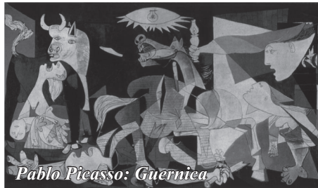
Pablo Picasso: Guernica

Sokrétű a helyzet és a várható következményei kiszámíthatatlannak tűnnek. Nekünk ezzel kell együtt élnünk. Nincs más választásunk. Ez most egy olyan új helyzet, amire nem voltunk/vagyunk felkészülve. Próbáljuk a kialakult körülményeket megérteni, utána menni, tartani vele a ritmust, de a háború vagy béke vagy-vagy léte már a múlté.