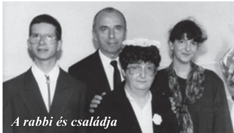
A rabbi és családja

- Ezt a horoszkóp dolgot nem értem. Ön hisz az asztrológiában?