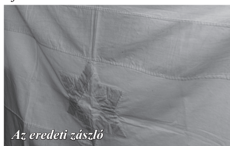
Az eredeti zászló