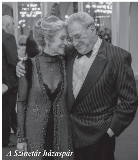
A Szinetár házaspár

Már kislánykorában is színésznő szeretett volna lenni, de számára a család az első. Egy iskolai válogatás következtében 13 évesen már tévéfilmben játszott, így ezután, 1960-tól a Magyar Televízió gyermekszereplője lett. 1964-ben érettségizett a Budapesti Fazekas Mihály Gyakorló Általános Iskola és Gimnáziumban. Ez után egy évig lakberendezőként dolgozott.