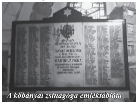
A kőbányai zsinagóga emléktáblája

Korábban már megemlékeztem elvesztett családtagjainkról, akikkel soha nem találkozhattunk. Nagyszüleim halálának helyszínéről (Auschwitz) pontos információkkal rendelkezünk, ám nagybátyámmal (apu testvérével) történtek esetében csak egy konkrét dátumig jutottunk el, illetve azt még bizonyosan tudtuk, hogy Buchenwaldban hunyt el.