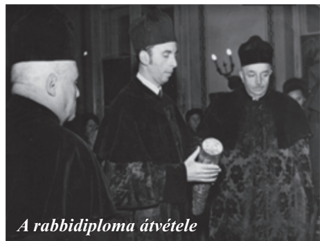
A rabbidiploma átvétele

- A Ki Sziszó (szefárd kiejtéssel: Ki Tiszá ) hetiszakaszában kerültem oda.