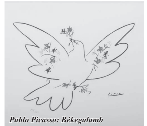
Pablo Picasso: Békegalamb

állapotával is törődnünk kell. Nehéz megtalálni azt a vékony ösvényt, amelyen járva segíthetünk, minél kevesebb kárt okozva - akár véletlenül - az amúgy is meggyötört embereknek. Kevesen vannak/vagyunk, akiknek van ebben tapasztalata.